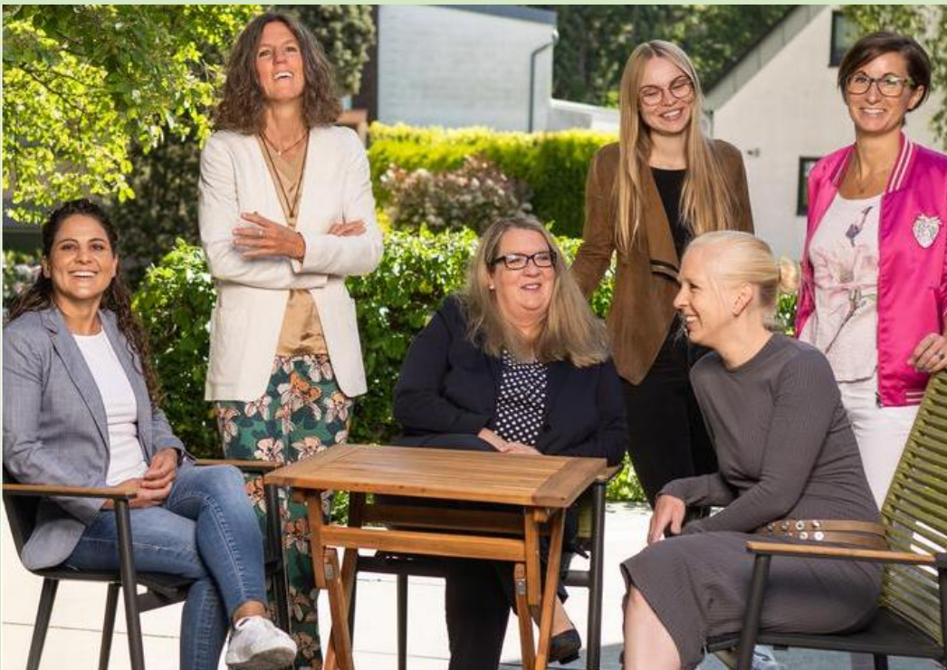
Weibliche Führungskräfte der BERGISCHEN (Sommer 2025)

Die Frauenquote kann ein hilfreiches Instrument sein, doch eine ausschließliche Fokussierung darauf streben wir nicht an. Wir setzen stattdessen auf eine qualifikationsorientierte Personalpolitik, die Fähigkeiten, Kompetenzen und Potenziale in den Mittelpunkt stellt. So sichern wir individuelle Entwicklung und die langfristige Leistungsfähigkeit unseres Unternehmens. Wir möchten Vorurteile abbauen, um echte Gleichstellung auf Augenhöhe zu schaffen, anstatt nur Quoten zu erfüllen.